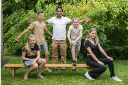
Leerlingenraad schooljaar 2022-2023

Hieronder ziet u een mooie foto van onze vorige leerlingenraad.